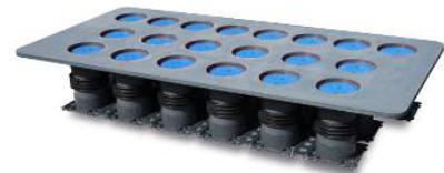
D-mex 150 Kabeldurchführung als Doppeldichtpackung mit Spachtelflansch auch als Paketbildung möglich