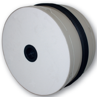
LMK Kunststoff-Futterrohr mit Innenkern