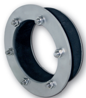
LMN individueller Dichteinsatz - GROSSFLANSCH