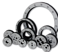
LMN individueller Dichteinsatz