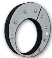
LMN individueller Dichteinsatz - geteilt