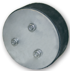
LMS N Blind