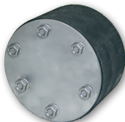
LMS D Blind