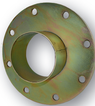
Flanschplatte galvanisch verzinkt